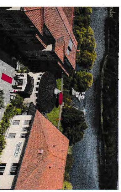
Seehotel Rheinsberg ***** am Grienericksee

Das barrierefreie Seehotel Rheinsberg liegt im Norden Brandenburgs im malerischen Ruppiner Land direkt am bezaubernden Grienericksee. Die Zimmer verfügen alle über ein eigenes Bad, Fernseher, Föhn, Telefon, Internet und einer Minibar. Das Schloss Rheinsberg mit Kammeroper und Musikakademie befindet sich in Laufnähe.