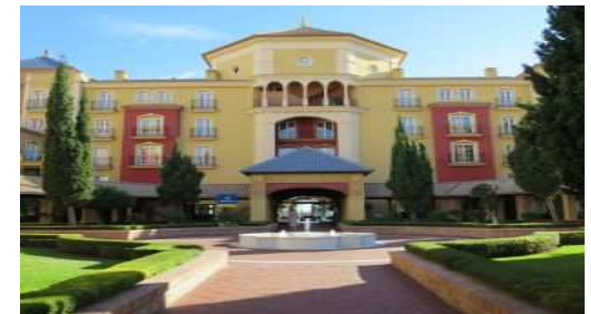
Hotel Iberostar Málaga Playa

Das Hotel ist im Stil eines Palastes aus 1001 Nacht erbaut und verfügt über ein Restaurant, eine Bar und eine Cafeteria, einen großzügigen Außenpool und ein Hallenbad mit Wellnessbereich. Die Zimmer sind modern ausgestattet mit Bad, Sat-TV, Telefon, Klimaanlage, Mietsafe und Minibar. Es liegt in der ersten Reihe zum Strand mit direktem Promenaden- und Strandzugang. In unmittelbarer Nähe befinden sich Geschäfte, Cafés und Restaurants.