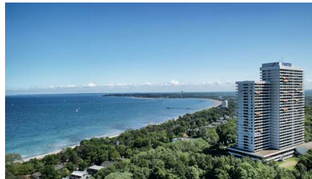
Maritim ClubHotel Timmendorfer Strand

Das Hotel Maritim ClubHotel liegt am Waldrand und ist nur wenige Gehminuten vom Ostseestrand entfernt. Es verfügt über 2 Restaurants, eine Bar, Innen- und Außenpool, Wellnessbereich, sowie Innen- und Außentennisplätze. Die Zimmer sind mit Bad, WC, Föhn, Smart-TV, Radio, Safe, Telefon und Minikühlschrank ausgestattet. Kostenloses WLAN.