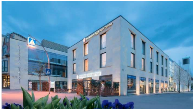
Best Western Plus Hotel Ostertor

Dieses moderne BEST WESTERN PLUS Hotel Ostertor liegt im Zentrum der Kurstadt Bad Salzuflen. Das 4-Sterne-Hotel verfügt über einen Wellnessbereich mit einer Sauna und einem Dampfbad. Alle Zimmer im Hotel Ostertor sind klimatisiert und verfügen über Sat-TV sowie kostenfreies WLAN. Die Altstadt von Bad Salzuflen mit den vielen Geschäften, Cafés und Restaurants sind in weniger als 5 Gehminuten zu erreichen.